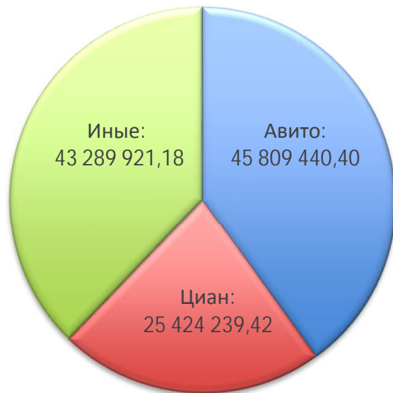
Доля рынка, численность